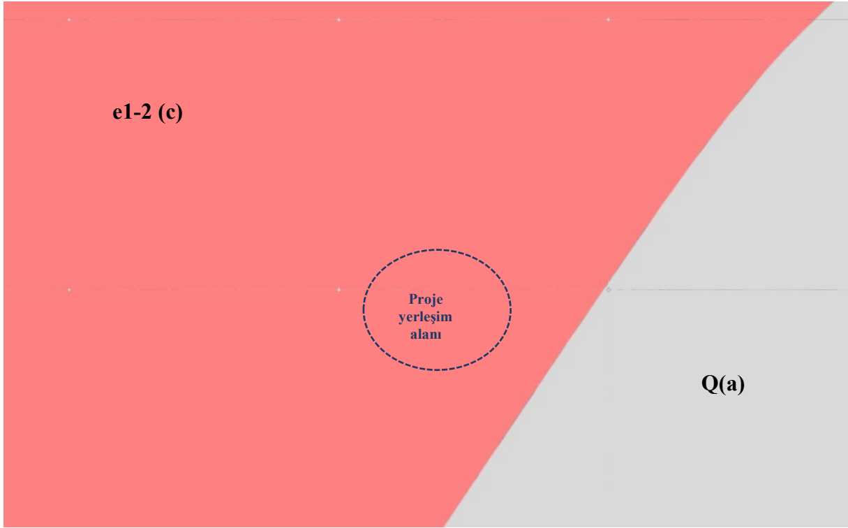
Şekil 5 .GES ve Yakın Çevresinin Genel Jeolojisi

Şekil 5’ te verilen genel jeoloji haritası incelendiğinde, proje sahası ve yakın çevresinin Eosen ve Kuvaterner jeolojik yaş aralığına sahip kaya birimleri ile temsil edildiği görülmektedir. Harita üzerinde proje alanının bulunduğu kesimde, e1-2 (c) ve Q(a) kodlu jeolojik birimler baskın litolojik özellik göstermektedir.