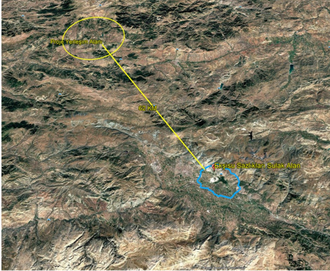
Şekil 7 Ekşisu Sazlıkları Sulak Alanı'nın Konumunu Gösterir Uydu Görüntüsü

Yapılan mekânsal incelemeler ve mevcut veriler doğrultusunda, proje yerleşim alanının korunan alanlar ve sulak alanlar ile herhangi bir mekânsal çakışmasının bulunmadığı, bu alanlarla doğrudan veya dolaylı bir etkileşim içerisinde olmadığı değerlendirilmiştir. Projenin konumu, ölçeği ve uygulanacak faaliyetlerin niteliği dikkate alındığında, korunan alanlar, sulak alanlar ve bu alanlara özgü ekosistem bileşenleri üzerinde olumsuz bir çevresel etki oluşturması beklenmemektedir. Bu kapsamda proje faaliyetlerinin, söz konusu alanların bütünlüğü ve ekolojik işlevleri üzerinde herhangi bir bozucu veya kısıtlayıcı etki yaratmayacağı öngörülmektedir.