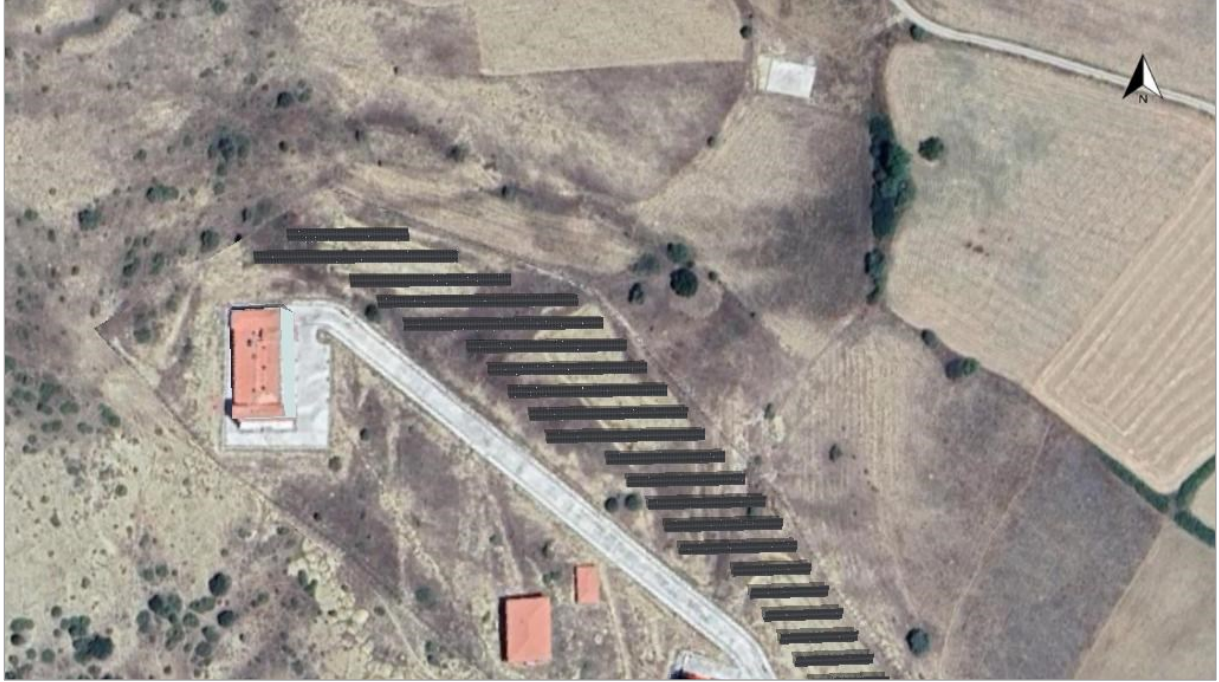
Şekil 2 Alt Proje Yerleşim Alanı