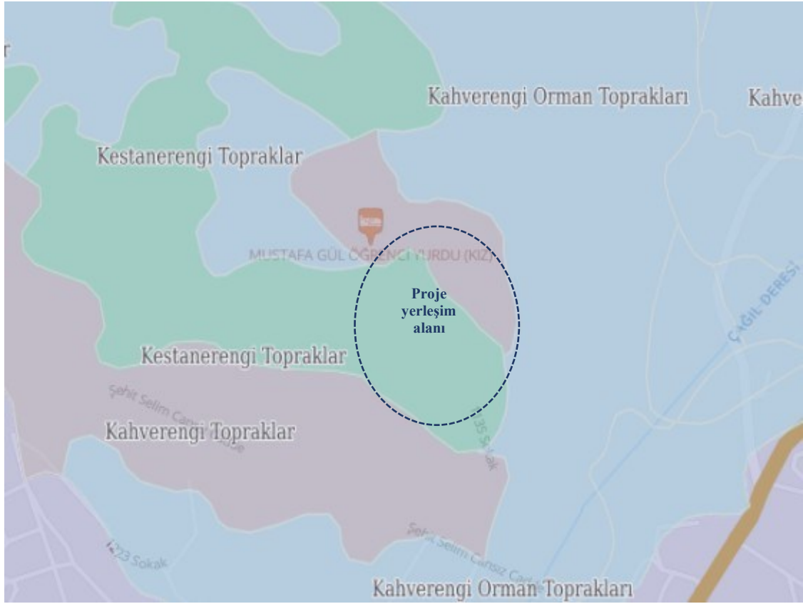
Şekil 4. GES ve Yakın Çevresinin Arazi Kullanım Durumu

TUCBS verilerine göre proje sahası ve yakın çevresi ağırlıklı olarak Kahverengi Orman Toprakları ile Kestane Toprakları birimlerinden oluşmaktadır. Söz konusu toprak birimleri, bölgesel toprak sınıflandırmaları kapsamında değerlendirilmiştir. Söz konusu toprak birimleri, bölgesel toprak sınıflandırmaları kapsamında değerlendirilmiş olup; genel olarak doğal ve/veya yarı-doğal ekosistem koşulları altında gelişmiş, orta derinlikte veya yer yer sınırlı derinliğe sahip toprak profilleri ile karakterize edilmektedir. Bölgenin topoğrafik özelliklerine bağlı olarak bazı kesimlerde toprak derinliğinin değişkenlik gösterebileceği değerlendirilmektedir.