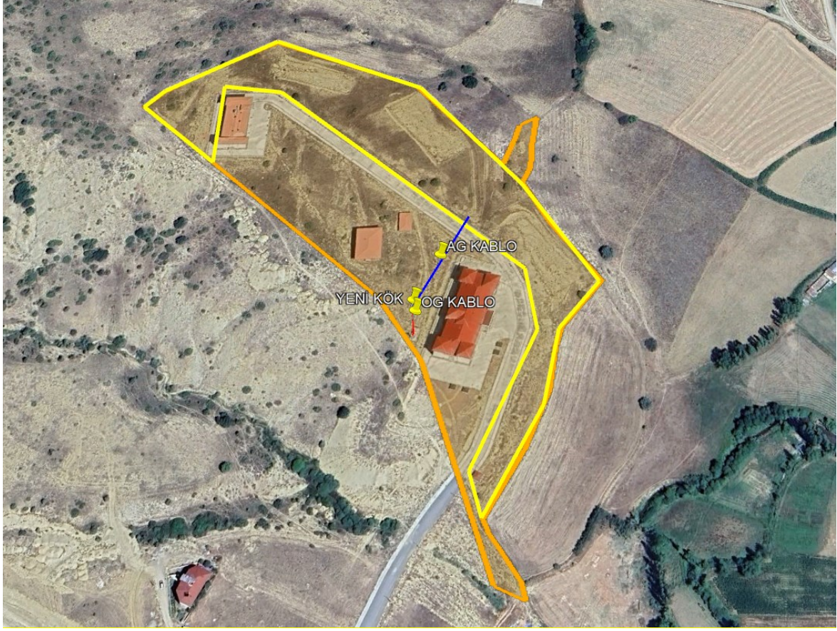
Şekil 1 Proje Alanı Uydu Görüntüsü